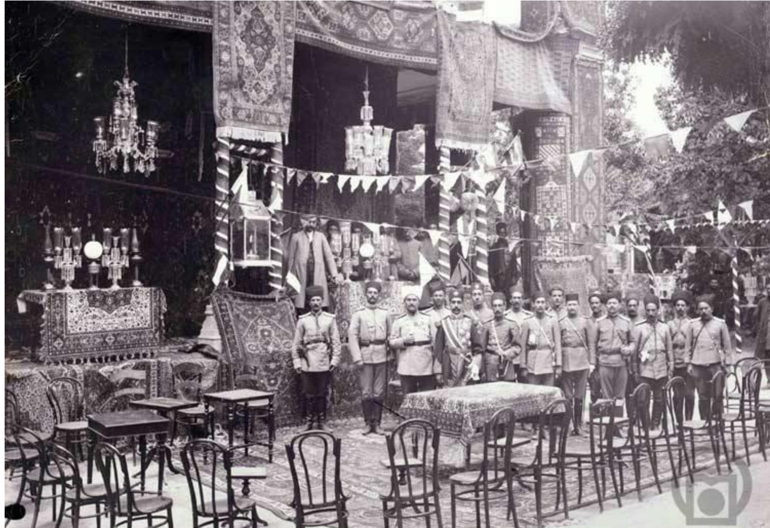
تاجگذاری احمدشاه قاجار ۱۷ ساله