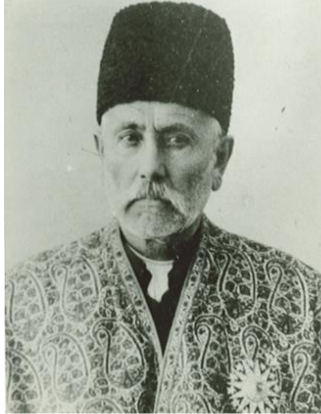
صمصام السلطنه بيطرفى خيرخواهانه