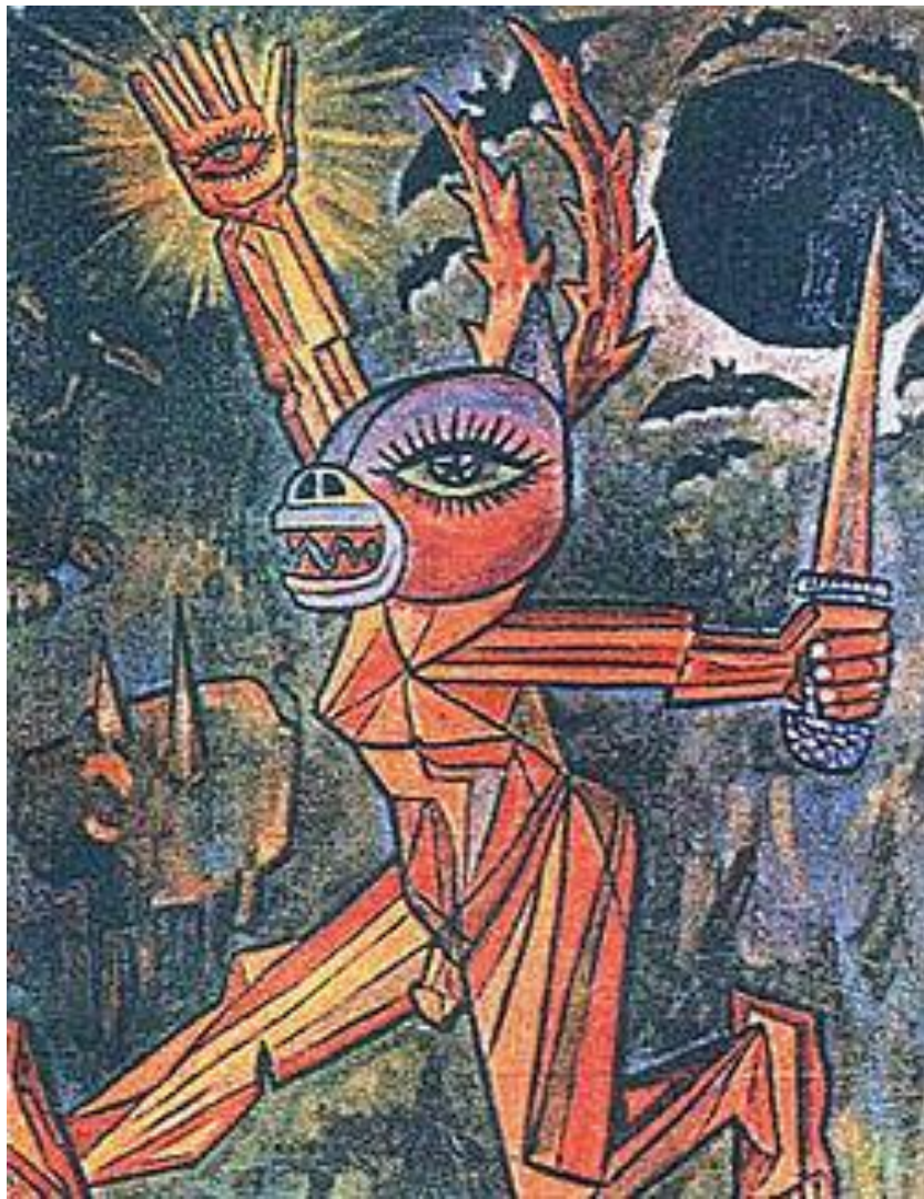
کوبیسسه سیاهکل، اثر بیژن جزنی

روشنفکران شهری نمی توانند روستایی انقلابی ایجاد کنند، تنها می توانند با آنها متحد شوند. (سیاهکل)