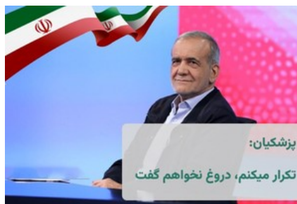
پزشکیان: تکرار می‌کنم دروغ نمی‌گوییم