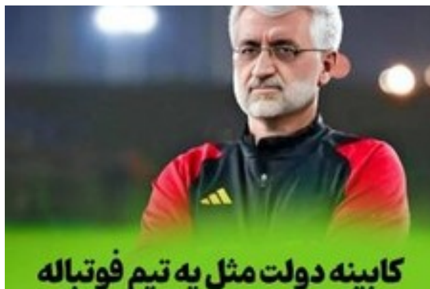
تو تیم کابینه رو بچین! کی دفاع کنه؟ کی بره نوک حمله؟