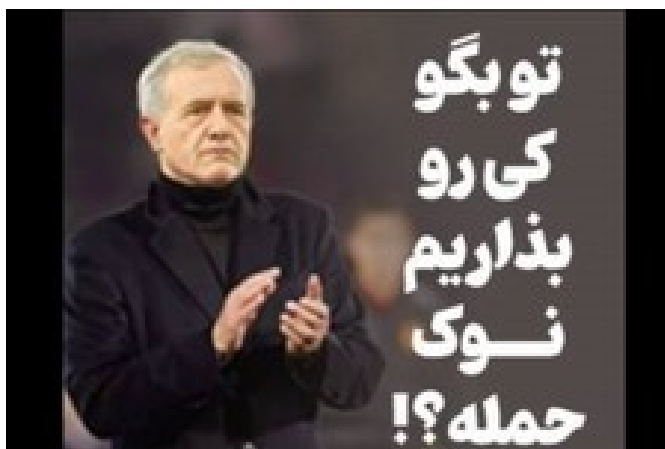
به نظرت بهتره رییس جمهور اصلا گل نخوره یا زیاد گل بزنه؟