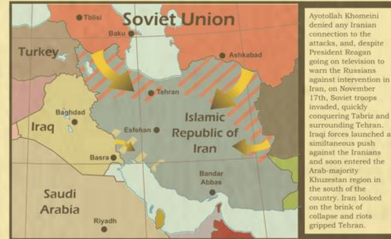
Soviet invasion and Iraqi advance