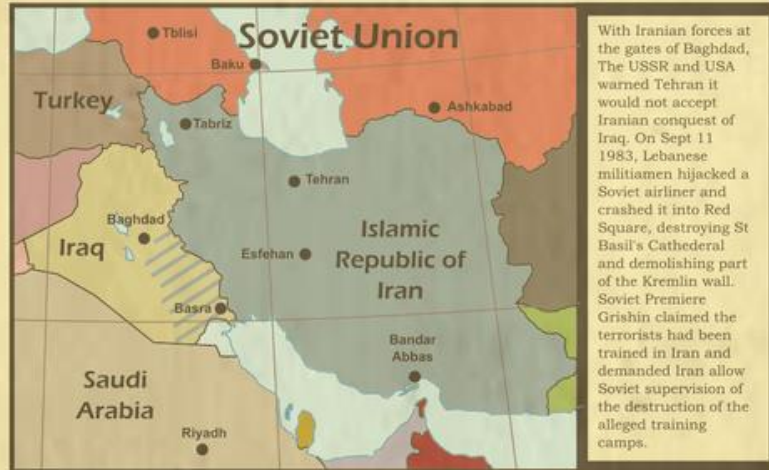
Situation before the Moscow Outrage