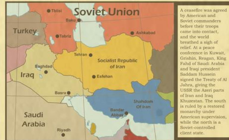
The Treaty of Al Jahra