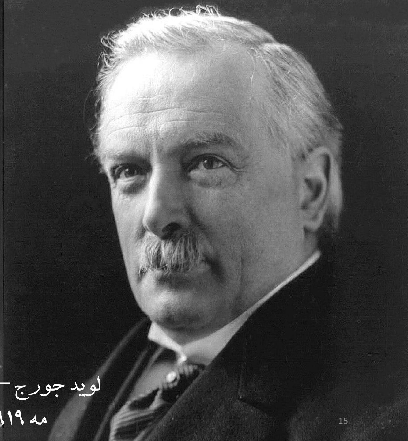
لوید جورج - کلمانسو مه ۱۹۱۹