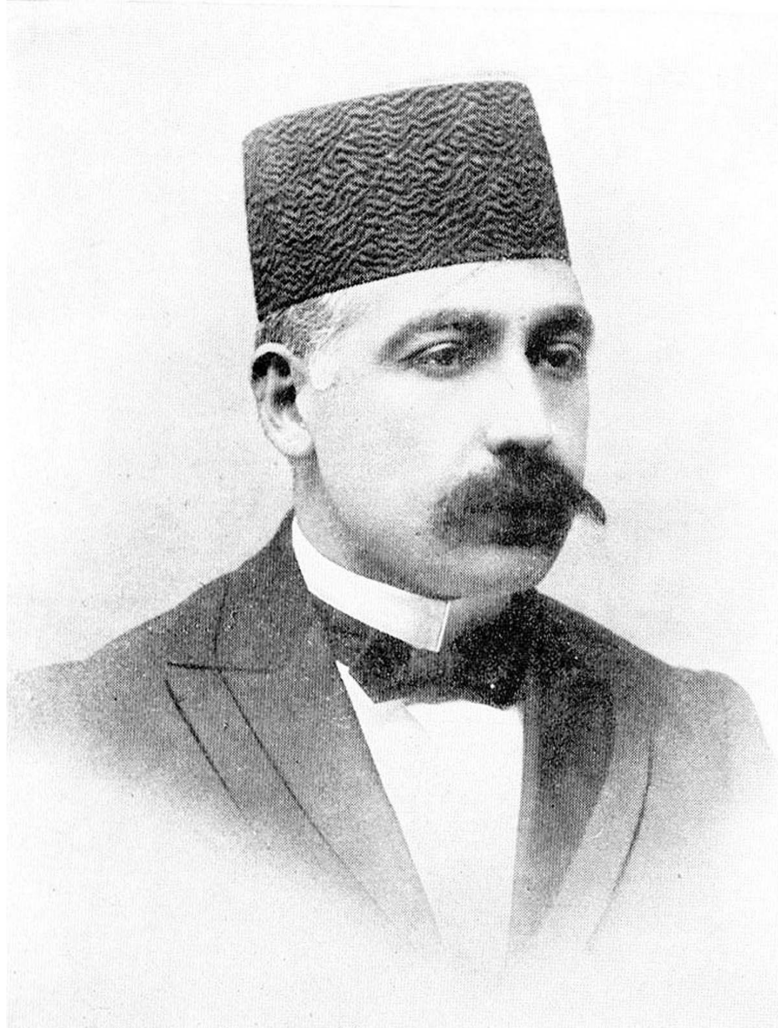
میرزا حسن خان وثوق الدوله (۱۲۹۷-۱۲۹۹)